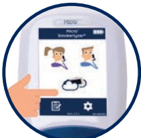
Einfach zu bedienende Benutzeroberfläche