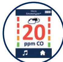
Überwachung des CO-Gehalts der Umgebungsluft