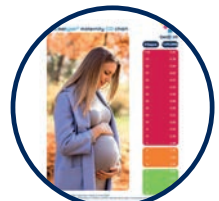
Vertrautes Ampelsystem mit grüner, gelber und roter Kennzeichnung