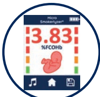
Automatische Umrechnung in % FCOHb