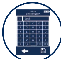
Patientendaten anlegen und speichern