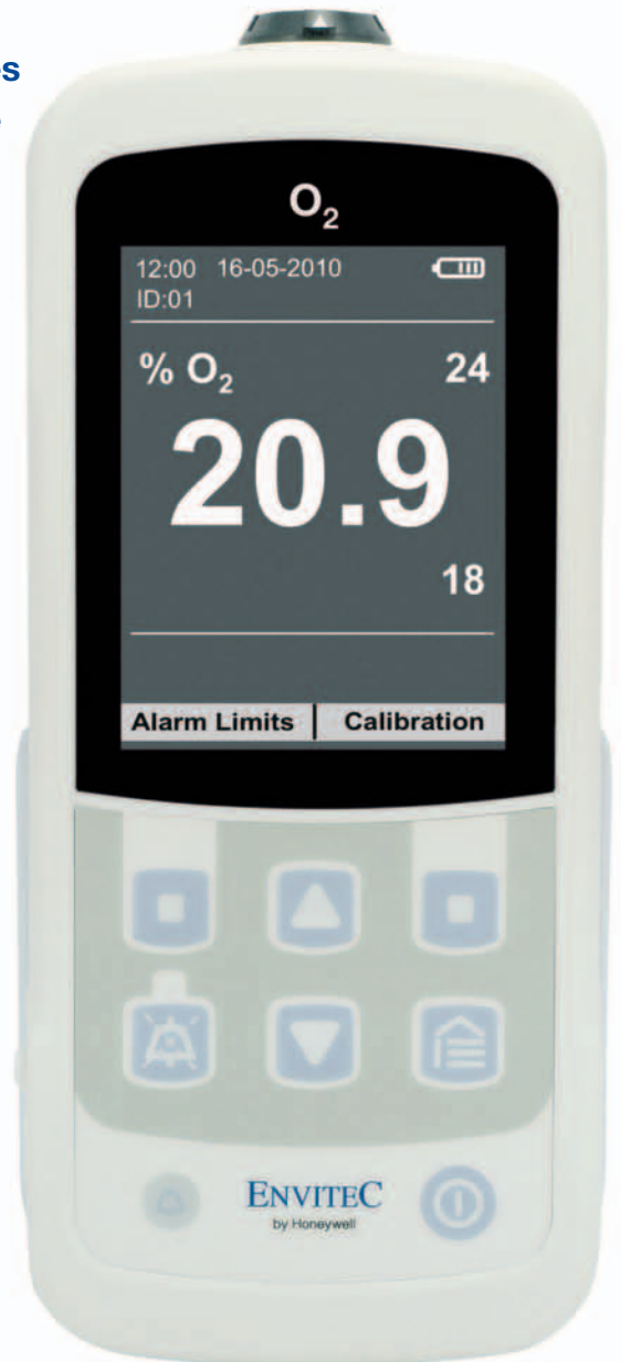
Appareil représenté dans les dimensions réelles

La disponibilité d'un MySign® O permet toujours un accès immédiat aux paramètres de ventilation FiO 2 de vos patients et garantit la sécurité requise, même dans les situations critiques.