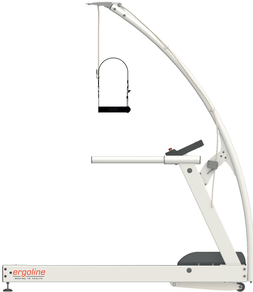
Abbildungen zeigen Sonderausstattung.