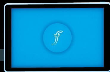
ProVu 8" Display

Der ProVu Display-Ständer mit Schwenkarm bietet Ihnen jederzeit die Möglichkeit, sofort die optimale Sichthöhe einzustellen.