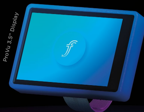
ProVu 3.5" Display